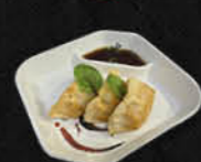
59. GYOZA (3 stuks)