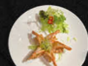
84. TOKYO GAMBAS (5 stuks)