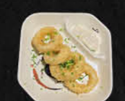
60. INKTVIS RINGEN (3 stuks)