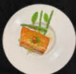
58. GEGRILDE ZALM